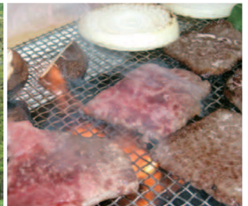
写真は全てイメージです

ツアーの内容につきましては、沙流ユーカラ街道活性化協議会より委託されている下記までお問合せ下さい。