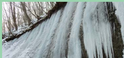
マカウシガロー氷瀑(イメージ)