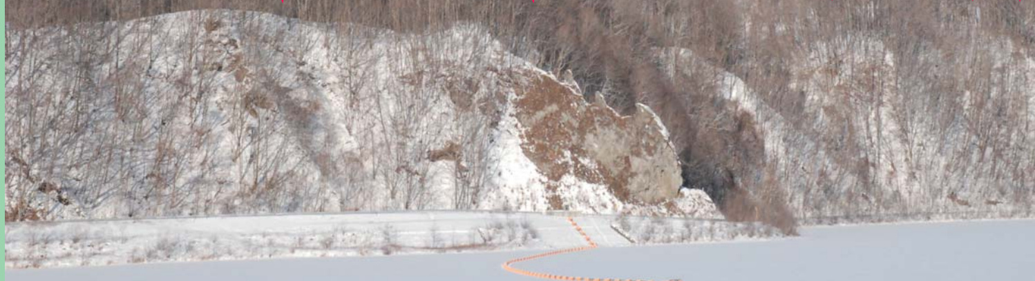
伝承地ウカエロシキ