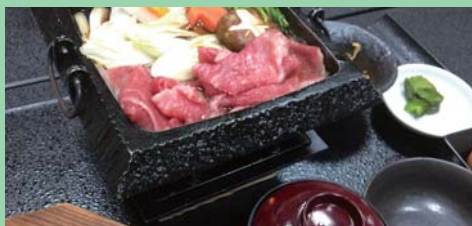
びらとり温泉ゆから すき焼き御膳 (イメージ)