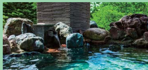
びらとり温泉ゆから (イメージ)