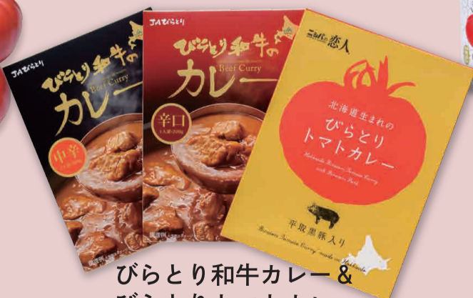
びらとり和牛カレー & びらとりトマトカレー