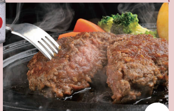
びらとり和牛のハンバーグ