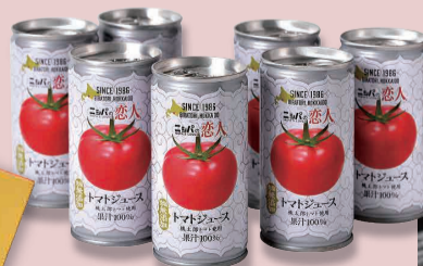
トマトジュース (ニッパの恋人)